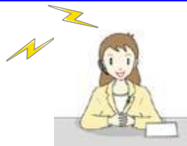
コミュニティ放送局 インターネット放送局